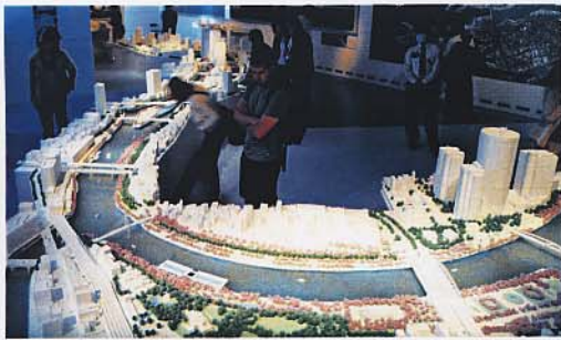
・大きさ: 約18m×10m(全長約20m) ・スケール: 1/300 中之島一帯(大川・堂島川・土佐堀川沿い)の約6km

「水の都」大阪の中心地である中之島一帯(大川を下り堂島川・土佐堀川が再び合流する区間)の街並みが再現されている巨大模型を展示しています。世界的な建築家安藤忠雄氏の建築研究所スタッフ他により製作されました。川沿いの桜並木・沿川建物の壁面緑化や、中之島剣先公園にある高さ30mの大噴水、といった安藤忠雄氏の提案が随所に盛り込まれています。必見です。是非ご覧ください。水の都を巡ってみたいくなりますよ!