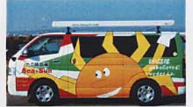
なにわ野菜を使ったベジたこなどで有名な「伊たこ焼き」など、お酒落で美味しいフードトラックチームも皆様をお待ちしております。