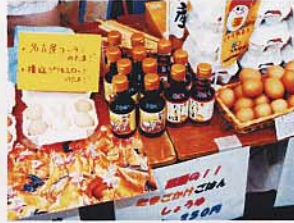
いずれも昨年(2009年)開催の「水都朝市リバーカフェ」からのスナップ風景です。