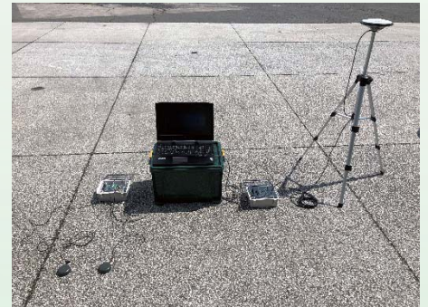
図2 機器(基地局、移動局)

UAV、ターゲッレスによるTLS計測、ワンマン測量、清掃作業等の出来高管理、作業車両の進行管理、重機のMC、MG