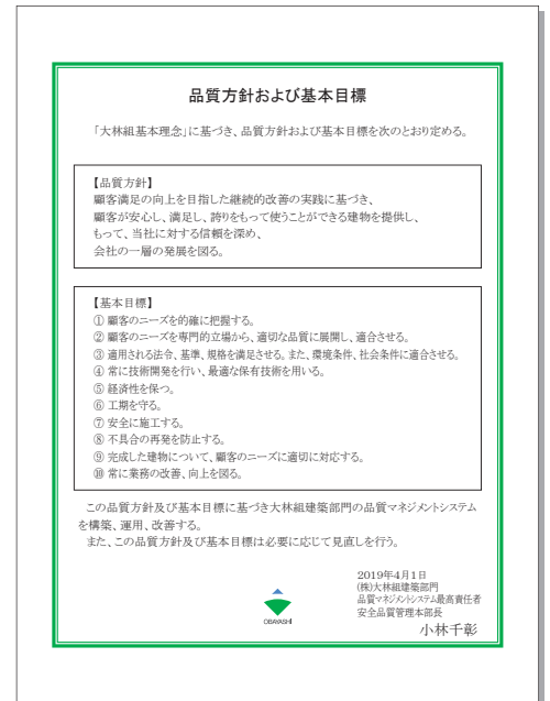
品質方針および基本目標