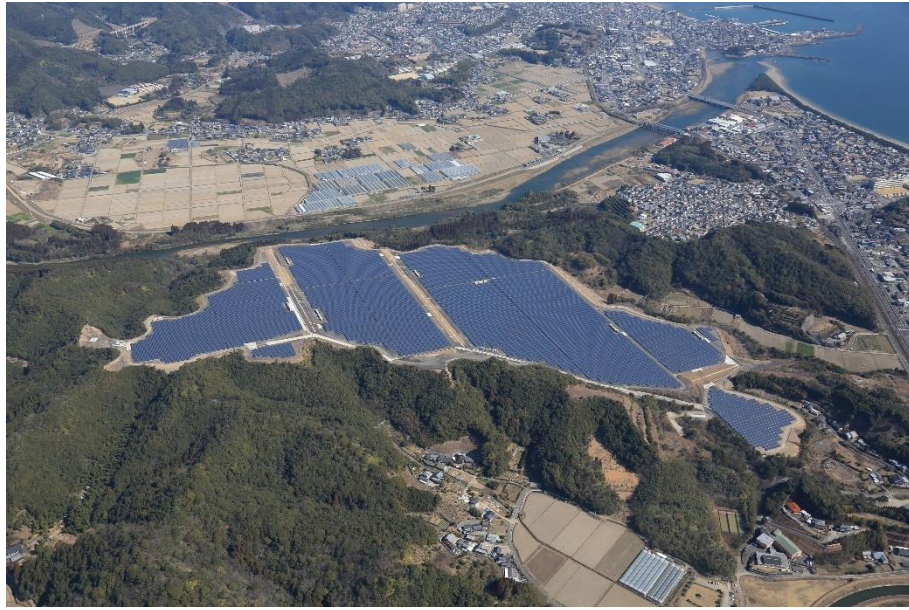
プロジェクト 03 日向日知屋太陽光発電所