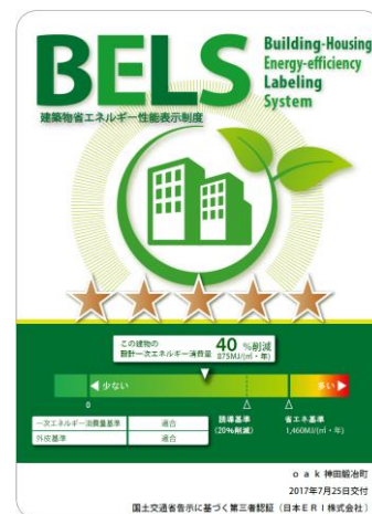
プロジェクト 06 oak 神田鍛冶町(商用ビル)