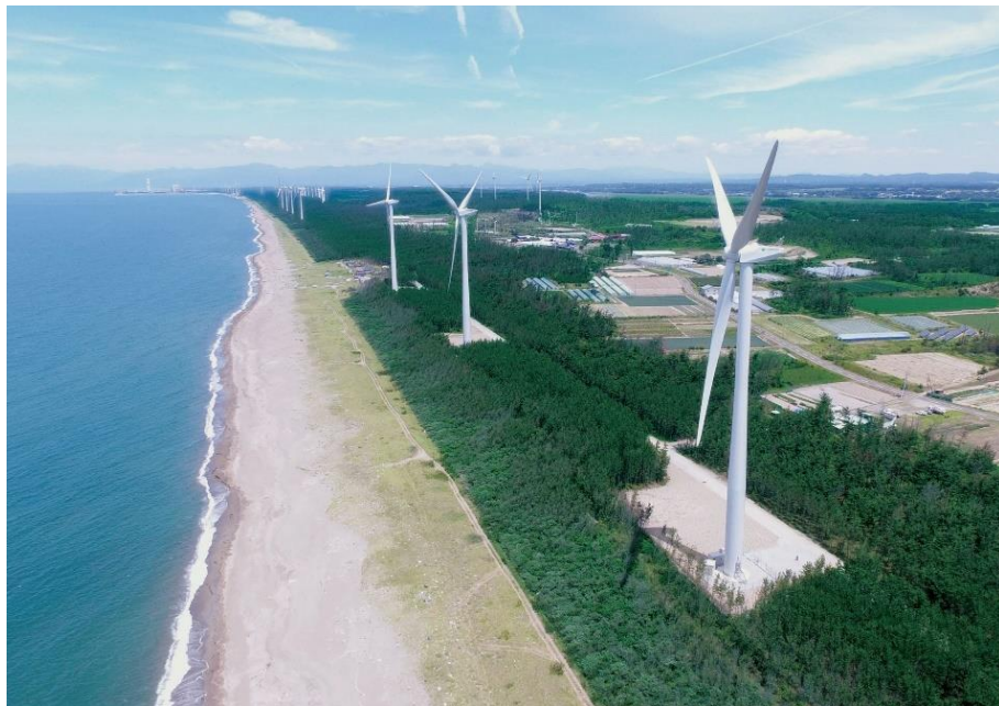
プロジェクト 04 三種浜田風力発電所