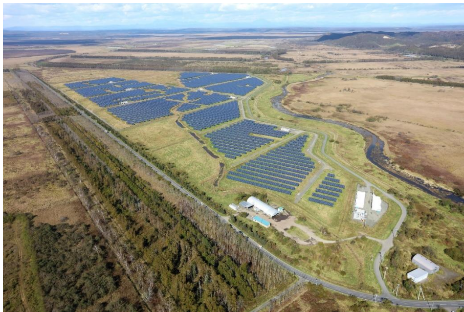
プロジェクト 02 釧路町トリトウシ原野太陽光発電所