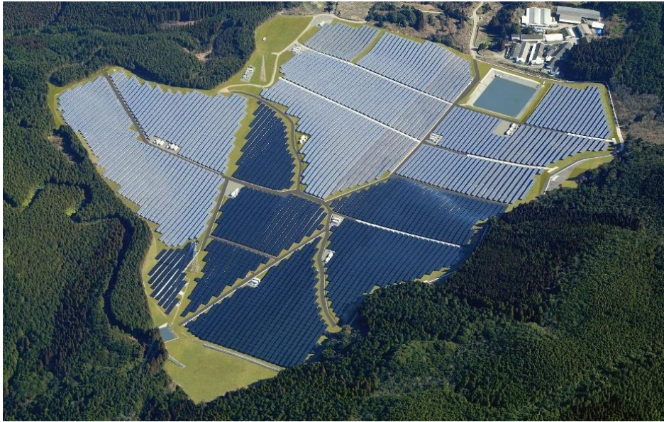
プロジェクト 01 芦北太陽光発電所