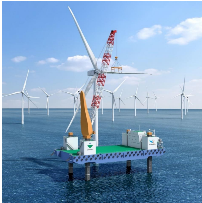
プロジェクト 05 自己昇降式作業台船 SEP (Self Elevating Platform) イメージ