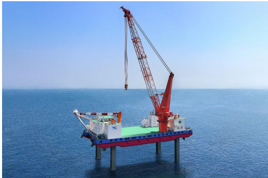
プロジェクト 05 自己昇降式作業台船 SEP (Self Elevating Platform) 「柏鶴 (はっかく)」 詳細は下記のウェブサイトをご参照ください。

https://www.obayashi.co.jp/news/detail/news20230512_1.html