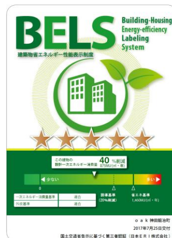
プロジェクト 06 oak 神田鍛冶町(商用ビル)