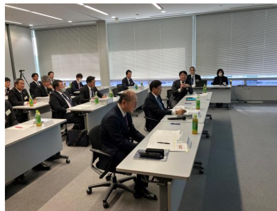
選考委員による質問

今回で7年目の開催となり、全国から計60件の応募がありました。業務改善テーマとして「安全性向上」「生産性向上」「働き方改革」を挙げ、特に「安全性向上」に関する提案を多数いただきました。本コンテストはこれまで書類選考のみでしたが、今回 プレゼンテーション形式による最終選考会 を採用しました。本日皆様から発表していただいた提案内容をぜひ お互いに現場で情報共有し、活かしていただく とともに、今後も 継続的な業務改善 を期待しています。